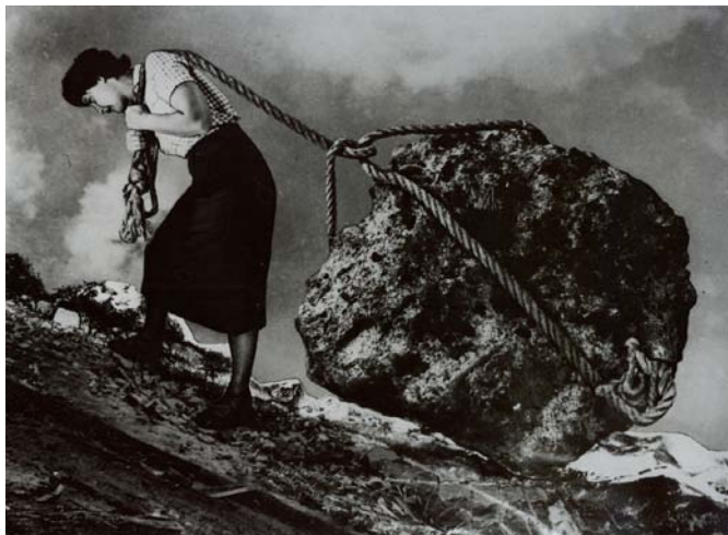
“Los sueños de cansancio”. Publicada en la revista Idilio en febrero de 1949.